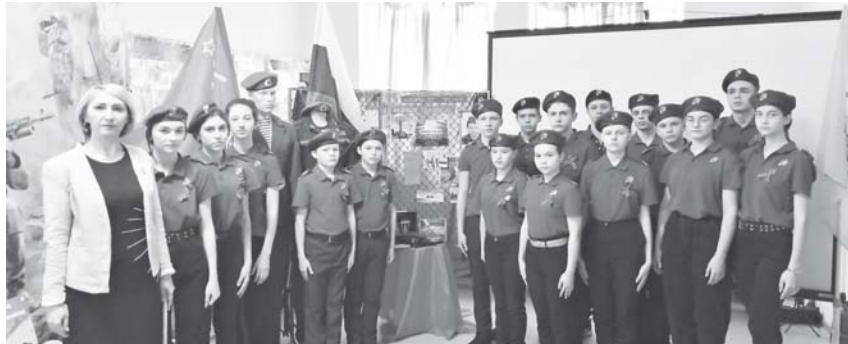
В музее школьники узнали о подвиге десантников

В марте в Новоалександровском районном историко-краеведческом музее прошёл урок мужества «Рота уходит на небо...», посвящённый 21-й годовщине подвига 6-й роты 104-го полка 76-й гвардейской Псковской дивизии ВДВ.