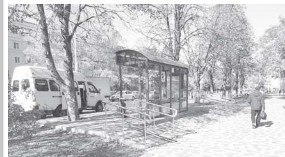
Всё для маломобильных граждан

В регионе при проведении работ в рамках национального проекта «Безопасные и качественные автомобильные дороги» учтут интересы маломобильных групп населения.